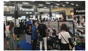
2022年グランドフェアの様子